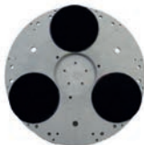
Hooky plate Ø 100/140