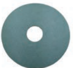
Papel de lija Ø140