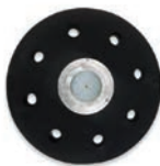
Disco de arrastre papel de lija