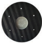
Disco de arrastre velcro 17"