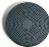
Disco de arrastre lana de acero