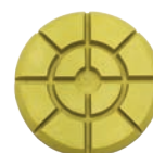
Luxo giallo Ø100 velcro